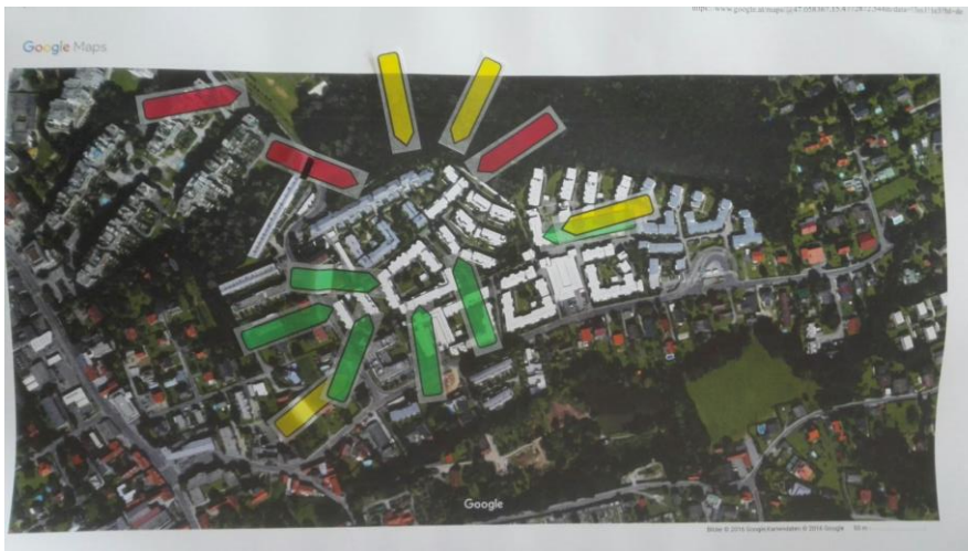
Abbildung 3 – Es wurde festgestellt, dass die Probleme sich nicht nur auf einen Ausschnitt der Siedlung beziehen, sondern ein Problem der kompletten Anlage darstellen. Einzig der Bereich der sexuellen Belästigungen scheint sich auf den mit roten Markern bezeichneten Bereich zu beschränken.

Ein weiteres Sub-Problemfeld aus dem Bereich der Infrastruktur ist jenes des Verkehrs in der Siedlung: Obwohl als verkehrsberuhigt geführt (Zufahrt nur für AnrainerInnen für Ladetätigkeit etc.) kommt es hier immer wieder zu Konfliktsituationen. Auch Motorroller und teilweise Radfahrer, welche in der Siedlung unterwegs sind, werden als häufig zu schnell und gefährlich erlebt.